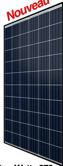
Sun-Watts 270 Silver Max Quad

NaviClub Le Supermarché Du Solaire À Québec