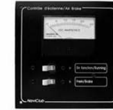
Contrôle Valeur de 2 0 0 $

Terrestre = 799.99$ OU: 699,99 sanscontrôle